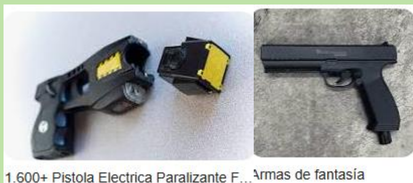
1.600+ Pistola Electrica Paralizante F... Armas de fantasía

Con la idea central de optimizar el control de las armas actualmente también figuran como elementos sujetos a control, las “armas basadas en pulsaciones eléctricas, tales como los bastones eléctricos o de electroshock y otras similares” (art. 2 h), y como elementos prohibidos, las armas transformadas para el disparo de municiones o cartuchos, y aquellas que carezcan de número de serie, añadiéndolas así a las que tenían número de serie adulterado o borrado (art. 3 inciso 1).